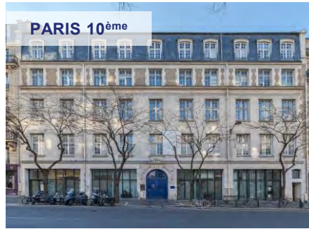
PARIS 10 ème