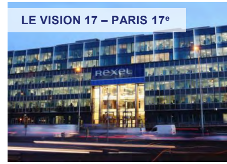
LE VISION 17 – PARIS 17 e

Exemples d'investissement déjà réalisés. Ne constitue pas un engagement quant aux futures acquisitions.