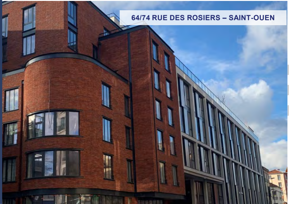
64/74 RUE DES ROSIERS – SAINT-OUEN

Exemple d'investissement déjà réalisé. Ne constitue pas un engagement quant aux futures acquisitions.