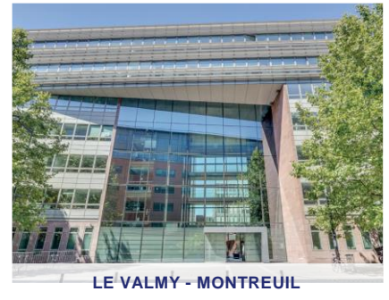
LE VALMY - MONTREUIL

Exemples d'investissement déjà réalisés. Ne constitue pas un engagement quant aux futures acquisitions.