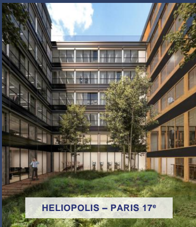
HELIOPOLIS – PARIS 17 e

Grâce au dynamisme de sa collecte actuelle, Épargne Foncière développe et renouvelle un peu plus son patrimoine.