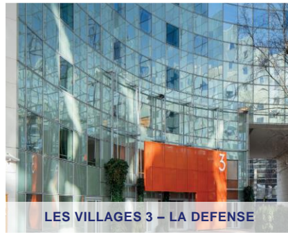
LES VILLAGES 3 - LA DEFENSE